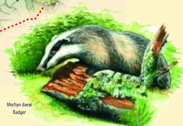
Mochyn daear Badger