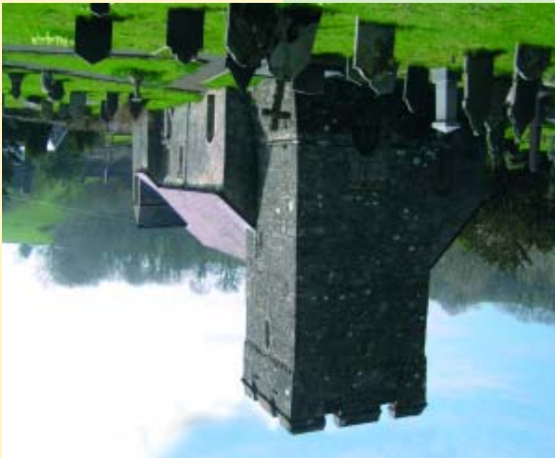
The Cross of Eudon

The quiet rural village of Llanfynydd is set in a sheltered valley some ten kilometres to the north of the A40 and the River Towy. The landscape is characterised by steep-sided valleys topped by rugged wind-swept uplands. A rich mosaic of pasture, ancient hedges, broadleaf woodland, planted pine forest, and rough grasslands provide important habitats that support a diversity of wildlife and present a varied backdrop that any walker can readily appreciate.